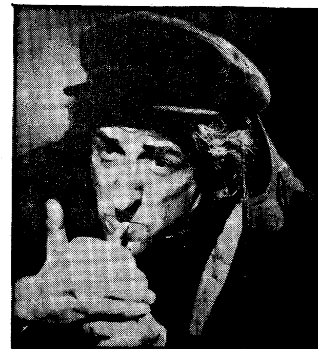
Giorgio Gaber in «Parlami d'amore Mariù»

Un Gaber drammatico a confronto con una realtà squallidamente senza sogni, teledipendente. Dove rifugiarsi? Nel buon vecchio «amore di Mariù», per rimpolpare quel che resta di sentimenti in definitiva scarni, con cianfrusaglie romantiche. Col suo «riprediamo dai sentimenti», Gaber traccia un applauditissimo itinerario intimo, un «riflusso» alla Gaber senza sconfitte, con la lucidità a volte amara di chi tasta il polso ai vuoti quotidiani, conservando gioiosamente i brevi attimi di sincerità. Anche per oggi, comunque, non si vola. Un Gaber domestico forse,